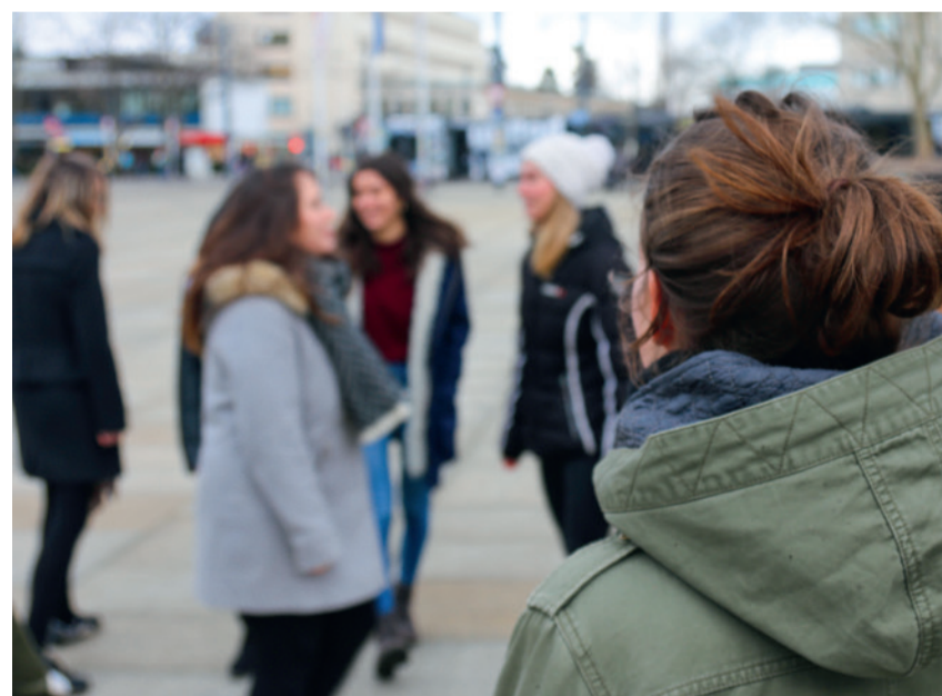
Menschen, die allein sind, sind nicht automatisch einsam. Auch in einer Gruppe kann man sich einsam fühlen.

In einer Versuchsreihe verabreichte Heinrichs den Patienten das Oxytocin per Nasenspray. Danach stellte er fest, dass sich die genannten Fähigkeiten verbessern. Außerdem lässt sich im Gehirn nachweisen, dass Regionen aktiviert werden, die für soziale Interaktion zuständig sind. „Das Hormon scheint extrem wichtig zu sein, damit wir angst- und stressfrei Nähe herstellen können“, folgert Heinrichs, „deshalb ist es im Zusammenhang mit Einsamkeit in gewisser Weise relevant.“ Er stellt die Hypothese auf, dass Menschen, die einsam sind und darunter leiden, Probleme mit dem Oxytocin-System haben könnten. Wissenschaftlich bewiesen ist dies aber noch nicht, da eine direkte Messung im Gehirn nicht möglich ist.