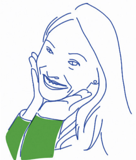
ILLUSTRATION: MARIE MAHEUX