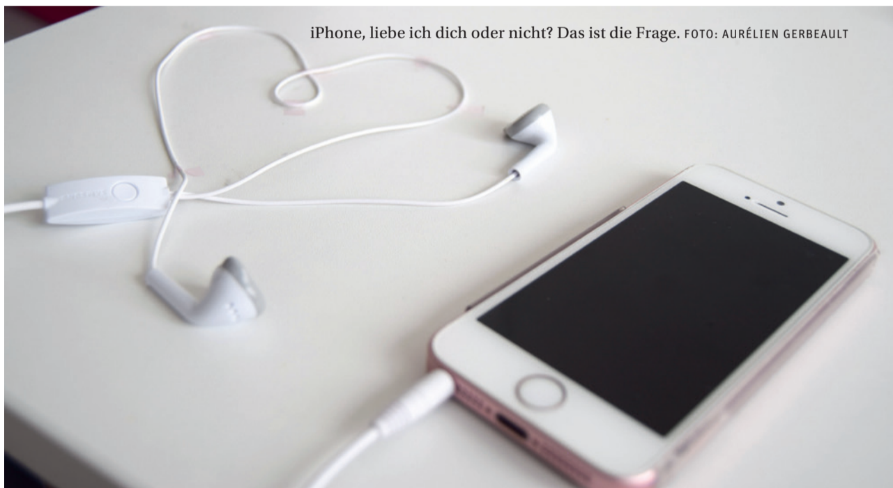
iPhone, liebe ich dich oder nicht? Das ist die Frage.

Apple selbst versucht, dieses Gefühl bei seinen Kunden zu entwickeln. Das fängt schon bei der Kaufsituation an: Die Geschäfte, sogenannte Apple Stores, „spiegeln das Image von Apple wider“, sagt Simion. Die Verkäufer sind oft jung, kompetent und hilfsbereit. Alles wird getan, damit der Kunde sich gut fühlt. Man gibt jedem einzelnen das Gefühl, dass er für die Firma