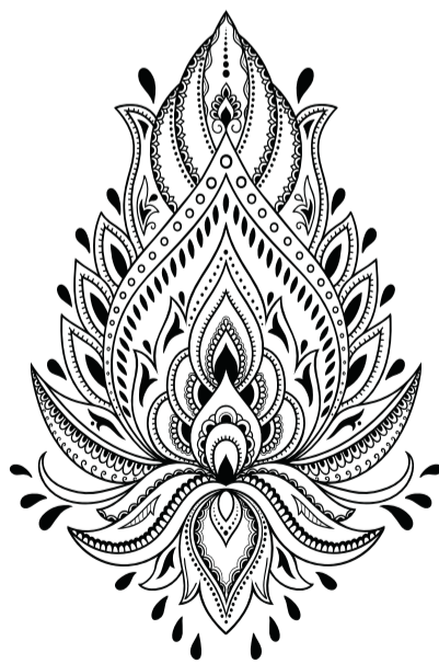
Die Lotusblume steht für Transformation, Reinheit, Liebe und spirituelle Erleuchtung.

Schwangeren Frauen, Personen mit Bluthochdruck, erhöhtem Augeninnendruck und anderen Augenkrankheiten sowie Epileptikern wird von der Teilnahme abgeraten. Bei ihnen kann das Hyperventilieren zu gesundheitlichen Schäden führen.