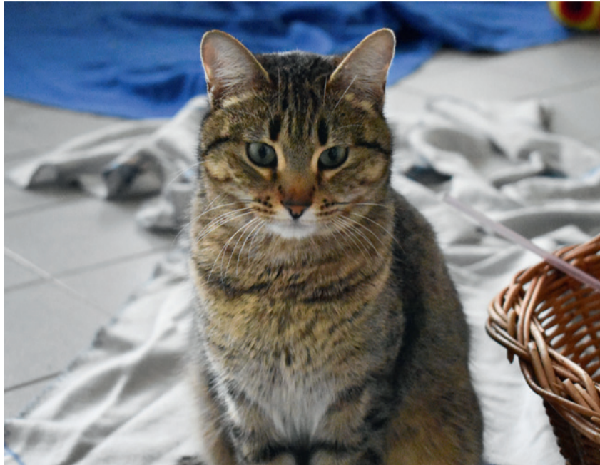
Viele Tiere aus dem Tierheim Freiburg sind noch auf der Suche nach einem Herrchen oder Frauchen, das ihnen Liebe schenkt.

„Liebe würde ich es nicht unbedingt nennen“, meint Raphaël Greiner, Angestellter des Tierschutzvereins. „Aber natürlich gibt es eine Bindung.“ Das beobachtet er jeden Tag an seinem Arbeitsplatz. Es braucht Zeit, um eine solche Bindung aufzubauen. Der potenzielle neue Besitzer kommt